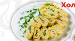
Слоеный виток с сырным кремом