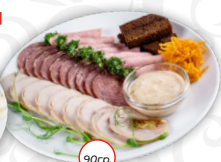
Мясное ассорти (рулет из ветчины с сырным муссом, рулет из цыпленка, сервелат фермерский, соус пикантный)