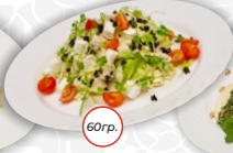
Салат с Цыпленком и сыром Фета