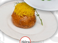
Жульен мясной в булочке, запеченный с сыром и картофельным кремом