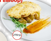
Свинина с томатами и сыром и картофельными дольками