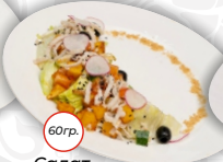
Салат с бужениной