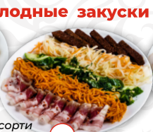
Ассорти под водочку с салом