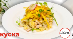
Салат (на выбор)