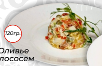
Оливье с лососем