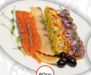
Ассорти рыбное (масляная нерка, лосо- севые роллы, сельдь шеф посола)