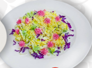
Салат Мясной дуэт