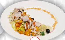
Салат с бужениной и имбирной заправкой