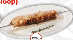
Шашлык из свинины