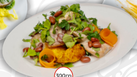
Кебаб из телятины с соусом песто и картофелем