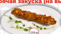
Шашлык из цыпленка