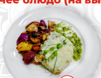
Бедро цыпленка в сливочном соусе с грибами, подается с картофелем