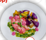
Свинина в соусе моцарелла с овощным гарниром