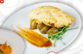
Цыпленок по-грузински с картофелем